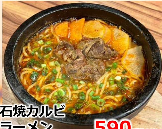
石焼カルビ ラーメン