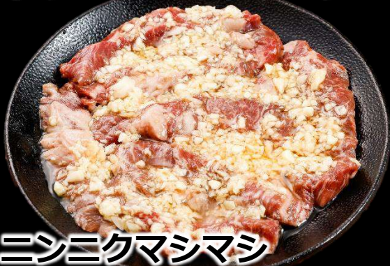
ニンニクマシマシ 名物とろハラミ 倍盛り