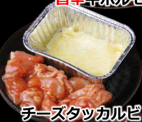
チーズタッカルビ