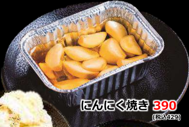
にんにく焼き 390 (税込429)