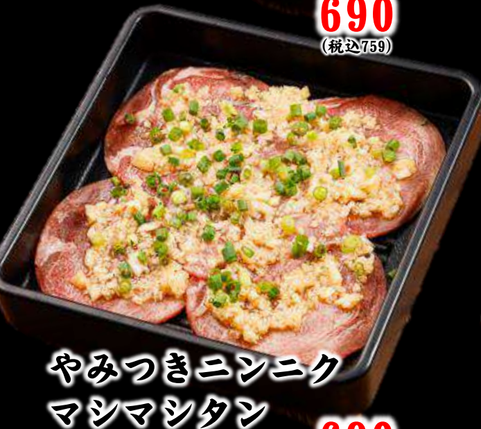
やみつきニンニク マシマシタン