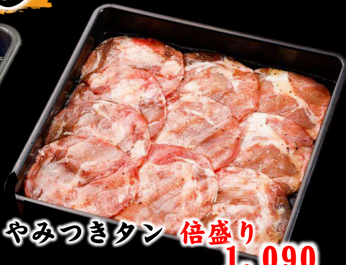
やみつきタン 倍盛り