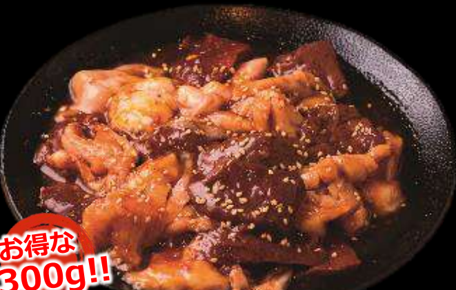
ホルモン盛り合わせ