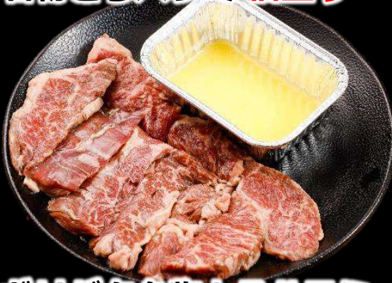
ガリバタ名物とろハラミ 倍盛り