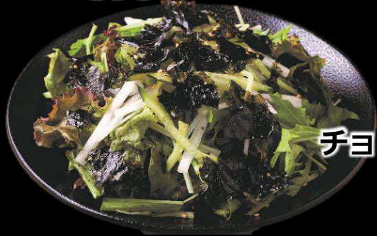
チヨレギサラダ 490 (税込539)