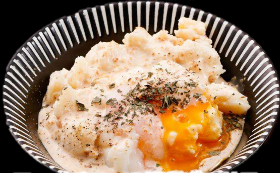
ヨーイチローの温卵ポテサラ 390 (税込429)