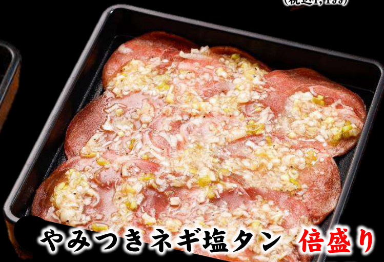
やみつきネギ塩タン 倍盛り