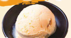
バニラアイス 200 (税込220)