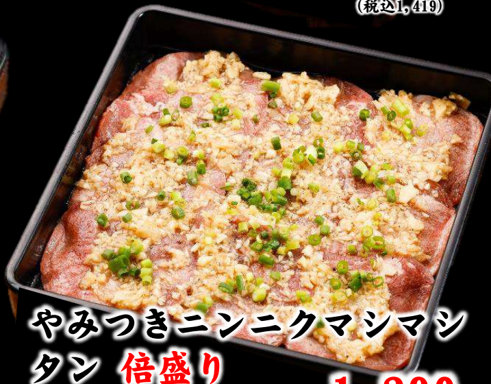
やみつきニンニクマシマシ タン 倍盛り