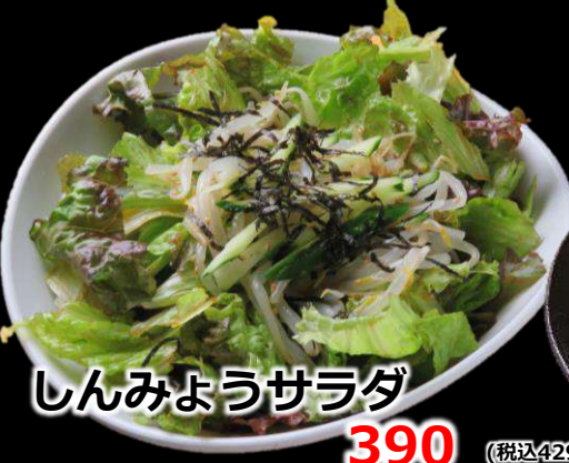
しんみょうサラダ 390 (税込429)