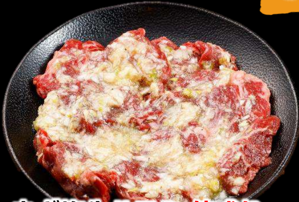
ネギ塩牛ハラミ 倍盛り