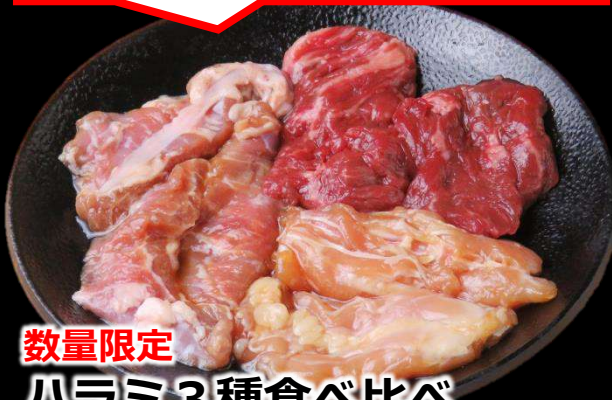
数量限定 ハラミ3種食べ比べ