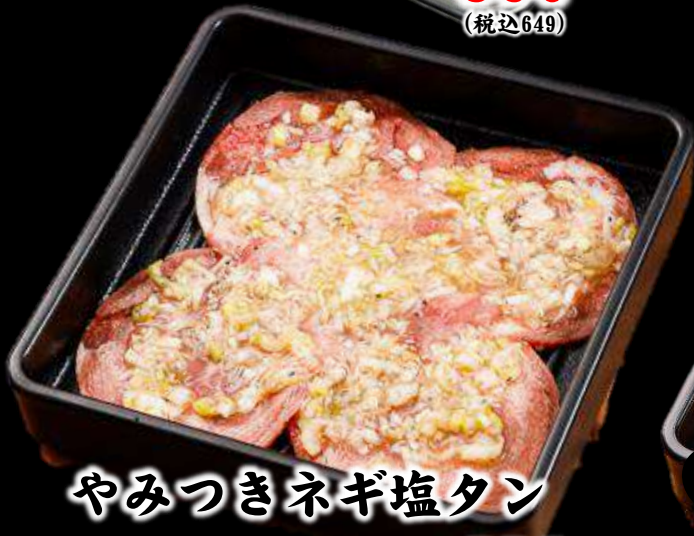
やみつきネギ塩タン