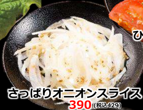
さっぱりオニオンスライス