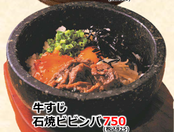
牛すじ 石焼ビビンバ 750 (税込825)