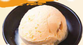
バニラアイス 200 (税込220)