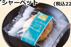
シューアイス (バニラ) 100 (税込110)