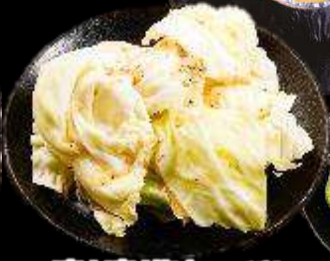
パリパリ塩キャベツ 390 (税込429)