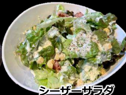
シーザーサラダ 390 (税込429)