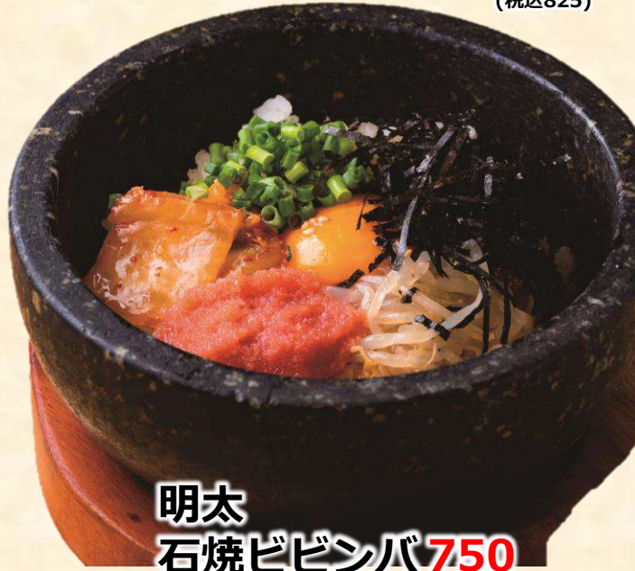
明太 石焼ビビンバ 750 (税込825)