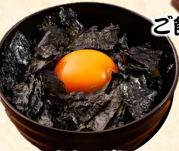
贅沢のりたっぷりご飯