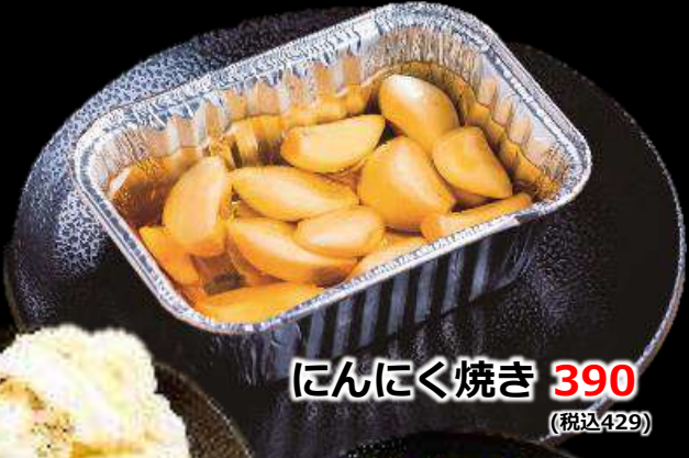
にんにく焼き 390 (税込429)