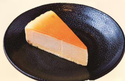
バイクドチーズケーキ 250 (税込275)