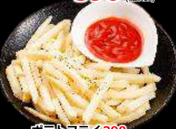
ポテトフライ 390 (税込429)