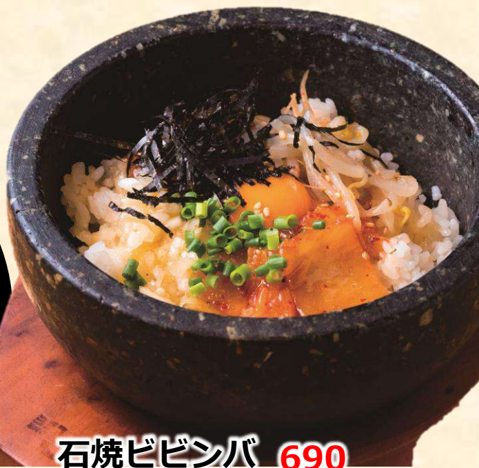
石焼ビビンバ 690 (税込759)