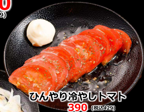
ひんやり冷やしトマト