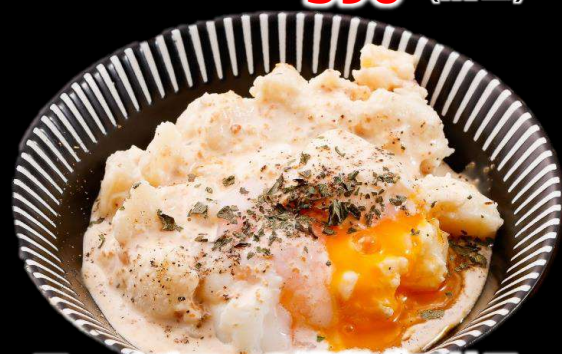
ヨーイチローの温卵ポテサラ 390 (税込429)