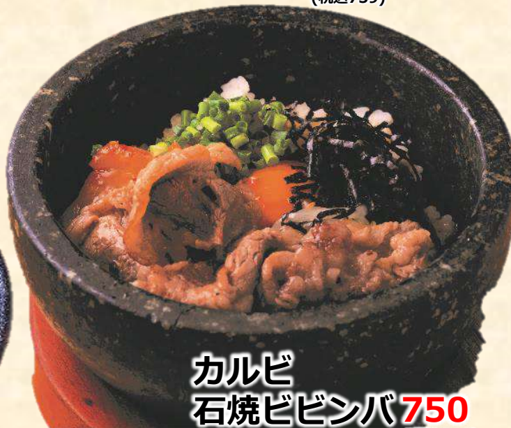
カルビ 石焼ビビンバ 750 (税込825)