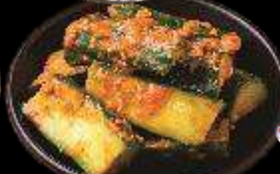
くせになるきゅうり