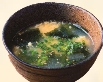
国産わかたま スープ 190 (税込209)