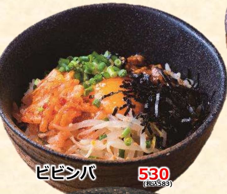
ビビンバ 530 (税込583)