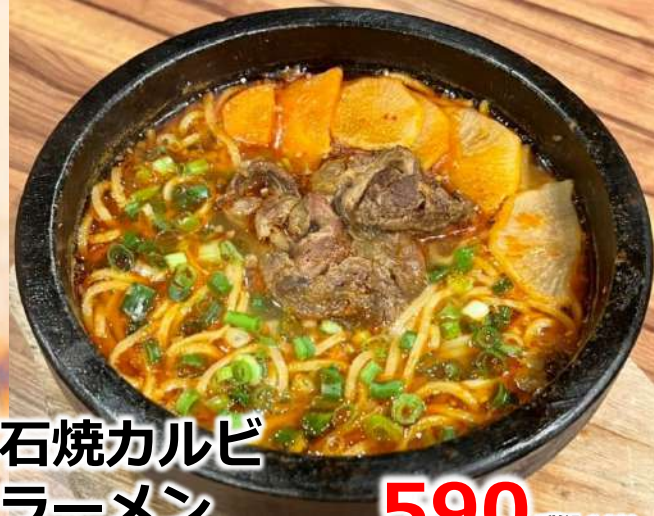
石焼カルビ ラーメン