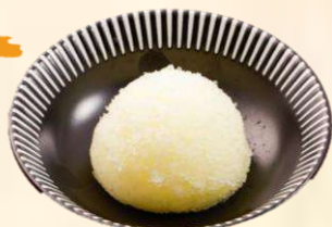
やっぱり! さっぱり♪ 200 ゆずシャーベット (税込220)