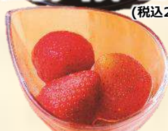
まるごと苺アイス 200 (税込220)