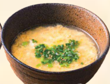
国産たまご スープ 190 (税込209)