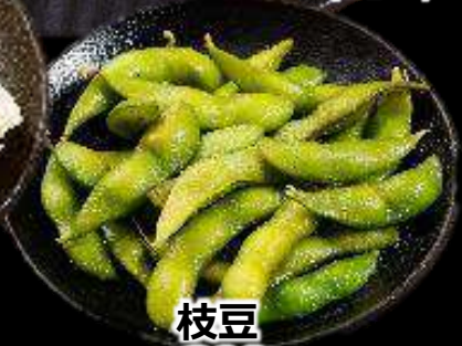
枝豆 290 (税込319)