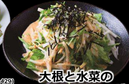
大根と水菜の さっぱりサラダ 390 (税込429)