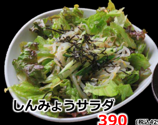
しんみょうサラダ 390 (税込429)