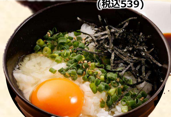
コーイチローが 本気で考えたT・K・G