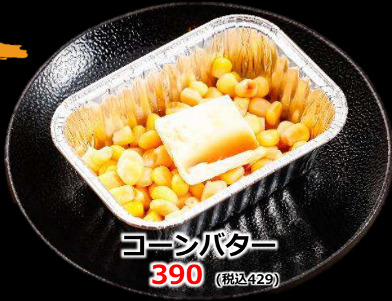
コーンバター 390 (税込429)