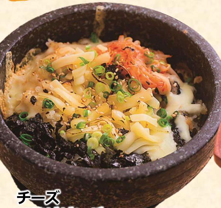
チーズ 石焼ビビンバ 750 (税込825)