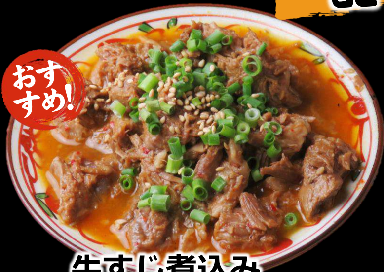
牛すじ煮込み 390 (税込429)